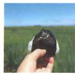
岩室温泉から車で15分

山麓の地下水で仕込む個性豊かな銘柄蔵元がズラリ。地域で長く愛される味をお楽しみください。