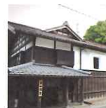
彌彦神社から車で5分

標高634mの彌彦山を一気に駆け上がるロープウェイ。日本海には遠くに佐渡が浮かびあがります。