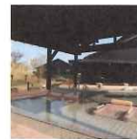
彌彦神社から車で5分