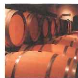
1岩室温泉から車で20分

窓からは農業景観広がる農家カフェや、炊きたて握りたておむすびが楽しめる「そら野テラス」が人気。