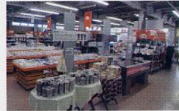
ストックバスターズ