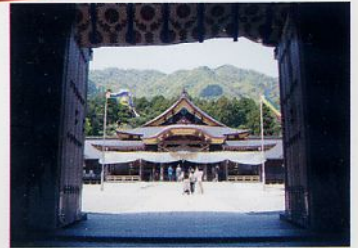
弥彦神社 (写真提供: 弥彦観光協会)