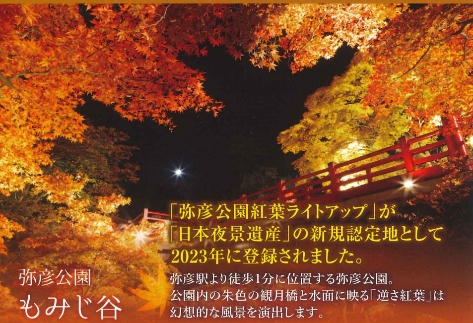
弥彦公園 もみじ谷

「弥彦公園紅葉ライトアップ」が「日本夜景遺産」の新規認定地として2023年に登録されました。