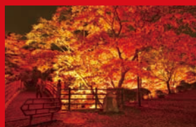
弥彦公園もみじ谷 弥彦村弥彦667-1

弥彦駅から徒歩1分。13万平方メートルにも及ぶ広大な弥彦公園は、その時季ならではの花や植物などが觀賞できるとあって、多くの観光客が足を運ぶ人気のスポット。なかでも、弥彦公園もみじ谷の紅葉が見頃を迎える10月下旬から11月中旬は、その美しい光景をひと目見ようと、一年で最も多くの人が訪れる。真紅に染まった約400本もの紅葉は一瞬で見ることのできる。ライトが照らされることで陰影が濃くなり、日中とは違う紅葉の表情に出会うことになるだろう。ライトアップは弥彦公園のほかにも、彌彦神社一の鳥居や玉の橋でも行われるので、こちらにも足を運んでほしい。