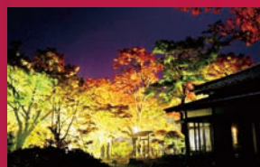
越路もみじ園 長岡市朝日600

応募用紙にスタンプを集めて応募箱に投函してください。抽選で各地域の名産品をプレゼント。 スタンプは弥彦観光案内所に設置しています。