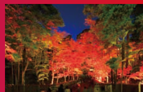
松雲山荘 柏崎市緑町3-1