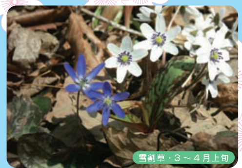
雪割草・3～4月上旬 弥彦山系で咲く雪割草は「オオスミソウ」が主で、花の色や形の変異が多いのが特徴です。

弥彦山山野草めぐりのマナー五箇条 その1：ごみは全て持ち帰りましょう！ その2：歩行中は煙草を吸わない！ その3：登山道は「のぼり優先」。すれ違うとき下りの人は待ちましょう！ その4：山歩きは動きやすい服装と万全の準備をしてトレッキングを楽しみましょう！ その5：コースを外れ、野草の群生地へ立ち入る行為はしないでください！ ※万一に備え、事前の登山保険等への加入をお願いします！